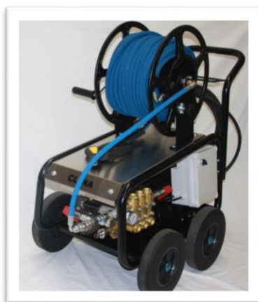
54.014.000 Slangetrommel til 60m. slange uten slange