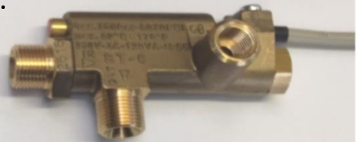
Flowswitch ST 6 48.101.01.