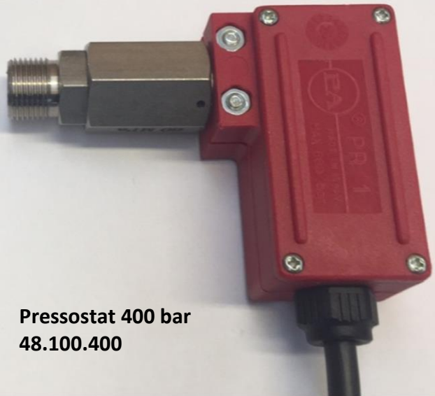
Pressostat 400 bar 48.100.400