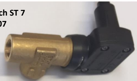
Flowswitch ST 7 48.101.107