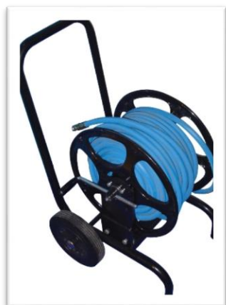
Slangevogn til 60m. slange, uten slange 54.014.999