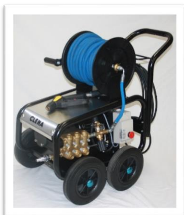
54.013.500 Slangtrommel til 20m. slange uten slange