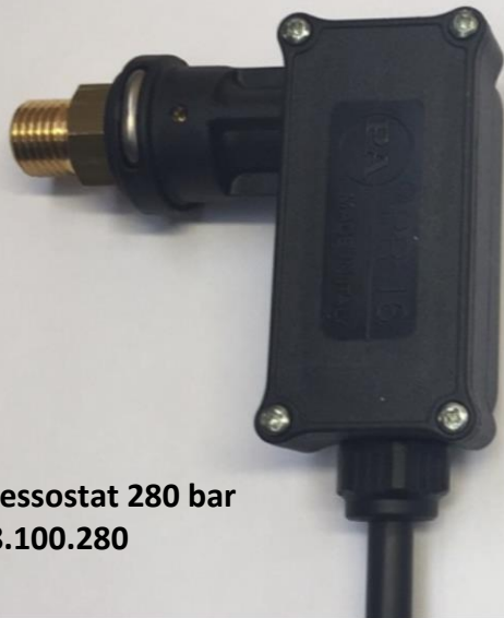
Pressostat 280 bar 48.100.280