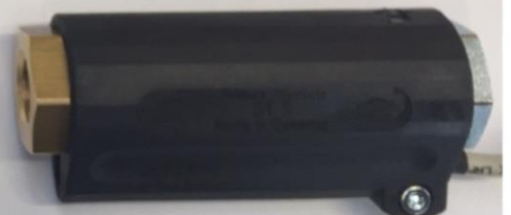
Flowswitch ST 5 48.103.000 43.326.200