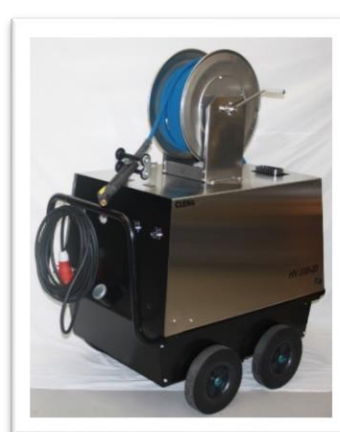
54.016.000 Slangetrommel, rustfri, 30m. slange uten slange