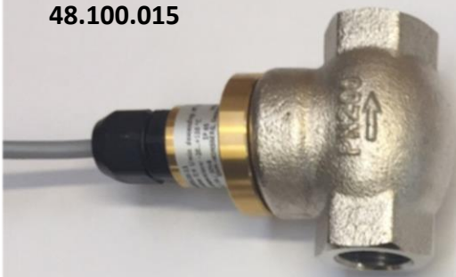
Flowswitch 1/2" 48.100.015