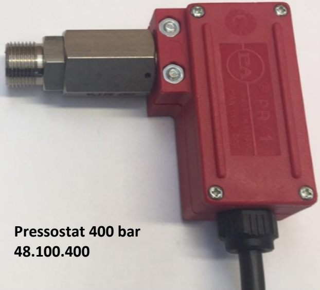
Pressostat 400 bar 48.100.400