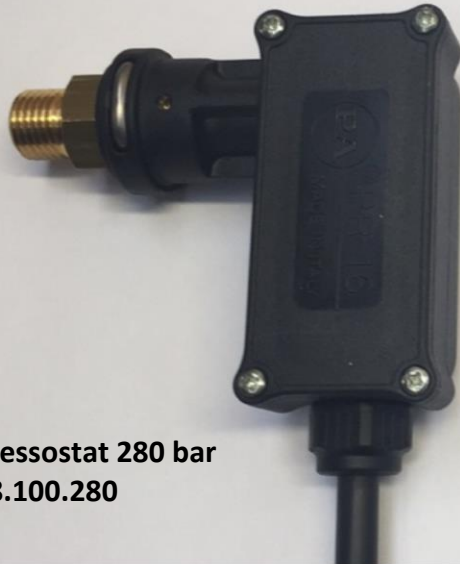
Pressostat 280 bar 48.100.280