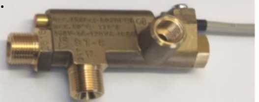
Flowswitch ST 5 48.103.000